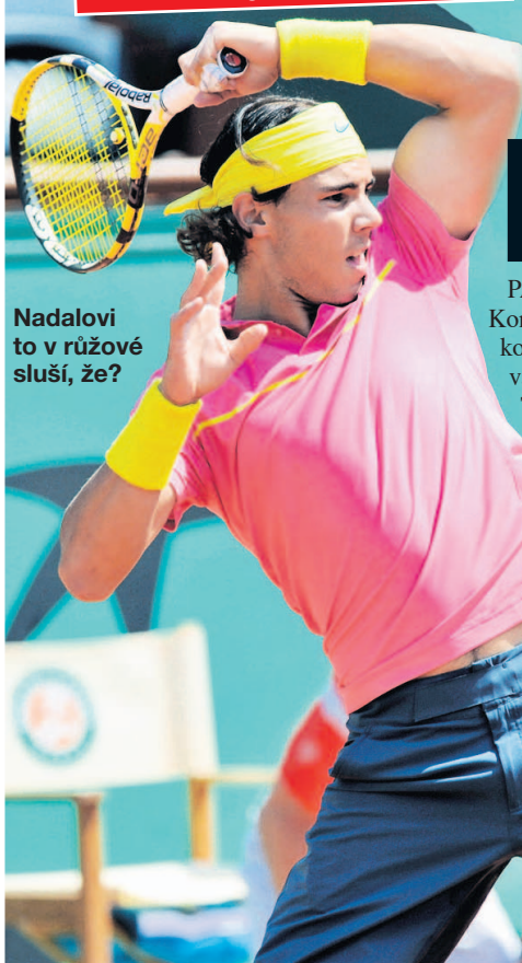
Nadalovi to v růžové sluší, že?