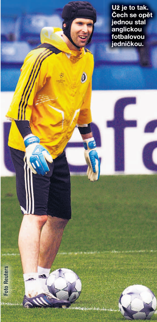
Už je to tak. Čech se opět jednou stal anglickou fotbalovou jedničkou.